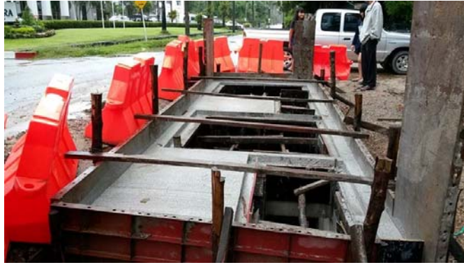
รูปที่ 4 การก่อสร้างระบบรวบรวมน้ำเสีย 4

อย่างไรก็ตามการก่อสร้างระบบบำบัดน้ำเสียแบบรวมกลุ่มอาคารของ อบต.เชิงทะเล ซึ่งแม้จะมีความเหมาะสมกับสภาพพื้นที่และสอดคล้องกับการเจริญเติบโตและสภาพปัญหาน้ำเสียที่เกิดขึ้นในพื้นที่ แต่ในเรื่องการดูแลเดินระบบ ผู้ดูแลระบบจะต้องเป็นผู้ที่มีความรู้ความเข้าใจอย่างมากในการทำงานของระบบ การควบคุมดูแล การซ่อมบำรุง ตลอดจนการตรวจสอบการทำงานของระบบ เนื่องจากระบบบำบัดน้ำเสียเป็นระบบที่มีเครื่องจักรอุปกรณ์มาก มีความยุ่งยากซับซ้อนในการเดินระบบ และโครงสร้างอยู่ใต้ดินทั้งหมด ในการติดตั้งและยกอุปกรณ์ต่างๆ ตำแหน่งของฝาบ่อและวัสดุที่ใช้จะต้องมีความเหมาะสมและสามารถเข้าทำงานได้โดยสะดวก เพื่อบำรุงรักษา เช่น เครื่องสูบน้ำ เครื่องเติมอากาศ และใบกวาดตะกอน เป็นต้น