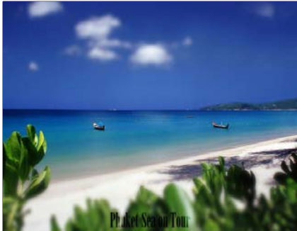
หาดบางเทาในเขต อบต.เชิงทะเล