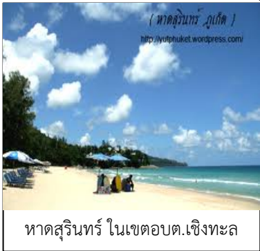
หาดสุรินทร์ ในเขตอบต.เชิงทะเล