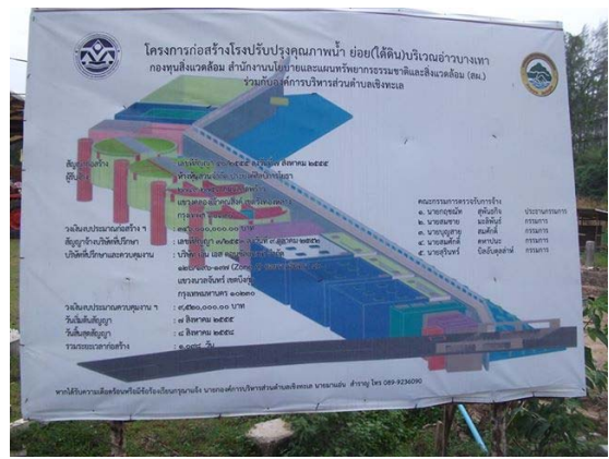
รูปที่ 2 โครงการก่อสร้างระบบบำบัดน้ำเสีย 4