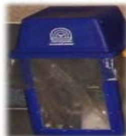
ถังขยะทั่วไป