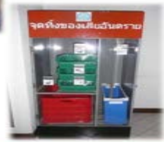
ตู้รองรับขยะอันตราย