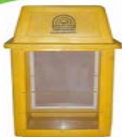
ถังขยะรีไซเคิล