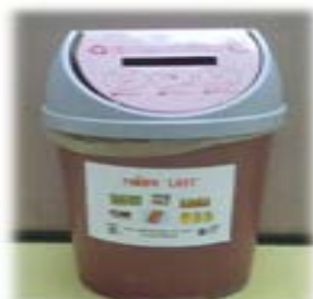
ถังรองรับกล่องเครื่องดื่มยูเอชที