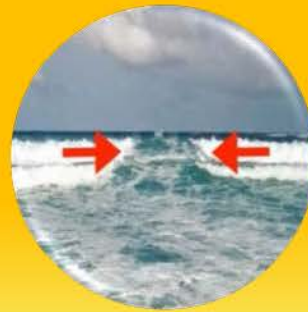
ฟองคลื่นมีการเคลื่อนที่ไหล ย้อนเส้นทางของคลื่น