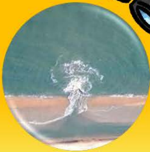
คลื่นหมุนวนมีลักษณะ เป็นรูปเห็ด