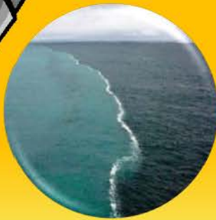
สีของน้ำทะเลแตกต่างกันอย่างชัดเจน