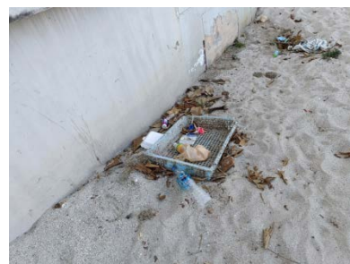
รูปที่ 2 การประเมินดัชนีคุณภาพสิ่งแวดล้อมชายหาดท่องเที่ยว (เบื้องต้น)

2) โครงการยกระดับคุณภาพน้ำพื้นที่ลุ่มน้ำทะเลสาบสงขลา ส่วนแหล่งน้ำทะเล กองจัดการคุณภาพน้ำ ร่วมกับสำนักงานสิ่งแวดล้อมภาคที่ 16 (สงขลา) ได้ติดตามตรวจสอบคุณภาพน้ำผิวดินในพื้นที่ จำนวน 15 จุด เมื่อวันที่ 14 - 22 กุมภาพันธ์ 2565 (ดังแสดงในรูปที่ 2) และได้กำหนดแผนติดตามตรวจสอบคุณภาพน้ำแหล่งน้ำผิวดิน และกำหนดแผนตรวจแหล่งกำเนิดมลพิษในเดือนพฤษภาคม