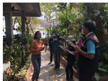
รูปที่ 4 การประชุมหารือ และติดตามตรวจสอบคุณภาพน้ำทั้งจากแหล่งกำเนิดมลพิษ

4) โครงการจัดการน้ำเสียในพื้นที่ปากน้ำปราณบุรี จังหวัดประจวบคีรีขันธ์ ซึ่งเป็นการดำเนินงานร่วมกับสำนักงานทรัพยากรธรรมชาติและสิ่งแวดล้อมจังหวัดประจวบคีรีขันธ์ และหน่วยงานในพื้นที่ที่เกี่ยวข้อง ส่วนแหล่งน้ำทะเล กองจัดการคุณภาพน้ำ ได้จัดประชุมหารือร่วมกับหน่วยงานที่เกี่ยวข้อง เพื่อพิจารณา (ร่าง) แนวทางการแก้ไขปัญหาน้ำเสียในพื้นที่ปากน้ำปราณ เมื่อวันที่ 10 มีนาคม 2565 ผ่านการประชุมทางไกล และ เมื่อวันที่ 3 - 8