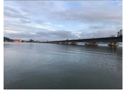
รูปที่ 3 ติดตามตรวจสอบคุณภาพน้ำผิวดิน

3) โครงการยกระดับคุณภาพสิ่งแวดล้อมชายหาดท่องเที่ยวพื้นที่เกาะเสม็ด จังหวัดระยอง ส่วนแหล่งน้ำทะเล กองจัดการคุณภาพน้ำ ได้รวบรวมข้อมูลการจัดการสิ่งแวดล้อมในพื้นที่เกาะเสม็ด และจัดประชุมหารือร่วมกับหน่วยงานในพื้นที่และหน่วยงานที่เกี่ยวข้อง เมื่อวันที่ 12 พฤศจิกายน 2564 และได้ลงพื้นที่หารือ สํารวจเก็บข้อมูล และติดตามตรวจสอบคุณภาพน้ำทั้งจากแหล่งกำเนิดมลพิษ (โรงแรม ร้านอาหาร และระบบบำบัดน้ำเสียรวม) เมื่อวันที่ 20 - 24 ธันวาคม 2564 (ดังแสดงในรูปที่ 4) เพื่อนำข้อมูลมาจัดทำรอบแผนปฏิบัติการยกระดับคุณภาพน้ำพื้นที่เกาะเสม็ด จังหวัดระยอง โดยจะมีการนำเสนอกรอบแผนปฏิบัติการฯ เพื่อรับฟังความคิดเห็นจากหน่วยงานที่เกี่ยวข้อง และผู้มีส่วนได้เสียในเดือนพฤษภาคม 2565