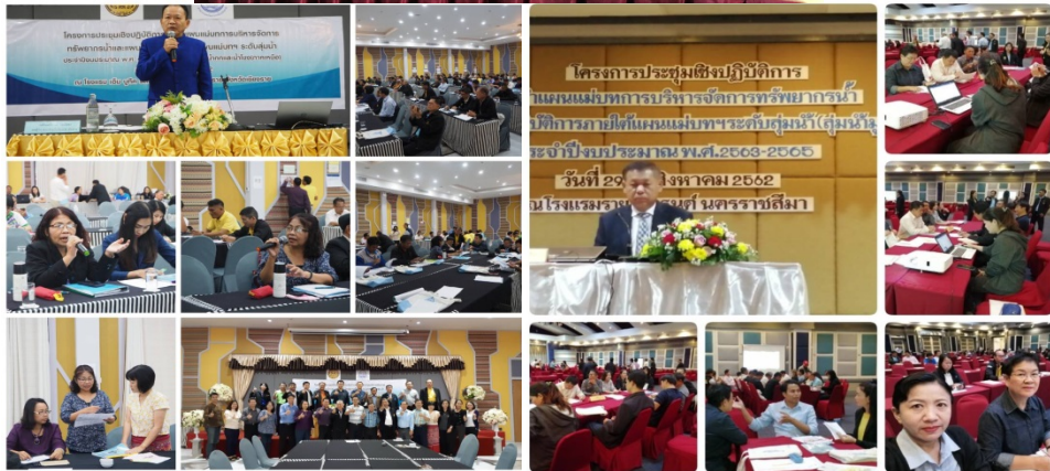
รูปที่ 1 การประชุมหารือร่วมกับหน่วยงานที่เกี่ยวข้อง